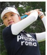
リ・エスト選手 <LPGAゴルフツアープロ>