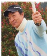
大町 昭徳選手 <PGAゴルフツアープロ>