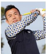
福永 和宏選手 <PGAゴルフツアープロ>