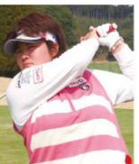
酒井 美紀選手 <LPGAゴルフツアープロ>