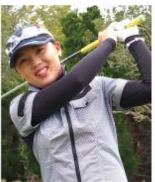
イ・ナリ選手 <LPGAゴルフツアープロ>